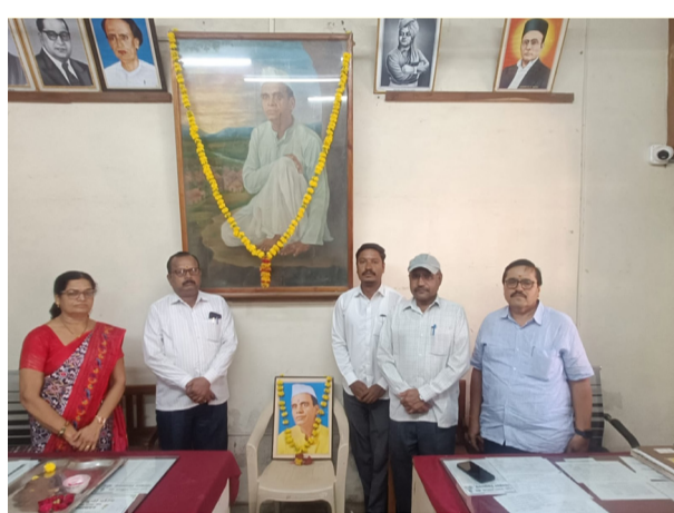
(मधुसूदन सोनवळकर/ दे.धर्मयोध्दा)

बौड - बौडच्या संस्कार प्रबोधिनी संस्थेचे प्रेरणास्थान