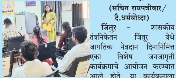
(सचिन रायपत्रीवार/ दे.धर्मयोध्दा)

शासकीय तंत्रनिकेतन जितूर येथे जागतिक नेत्रदान दिन मोठ्या उत्साहात संपन्न; विद्यार्थी आणि पालकांचा उत्स्फूर्त प्रतिसाद