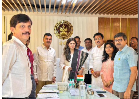
(मधुसूदन सोनवळकर/ दे.धर्मयोध्दा)

बौड - भटकंती करणाऱ्या मेंढपाळ बांधवांच्या जीवनात स्थिरता मिळावी यासाठी